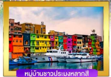
หมู่บ้านชาวประมงหลากสี