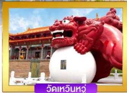
วัดเหวินหู่