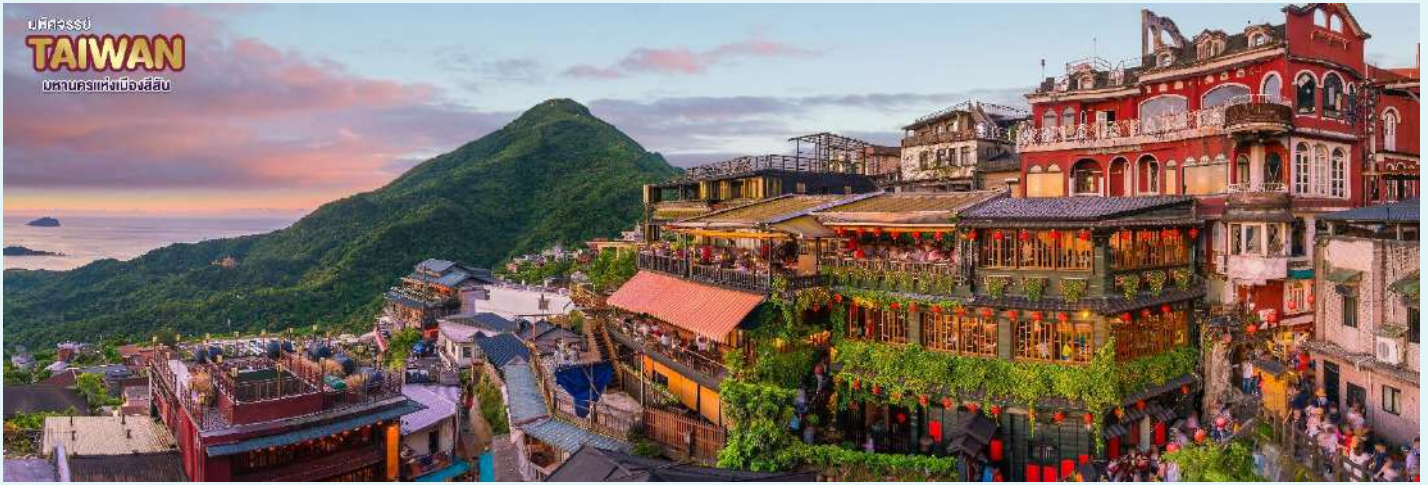
บหคจรรย TAIWAN มหานครแห่งเมืองสีสับ

จากนั้น นำท่านเข้าพักที่ เมืองเกาหยวน หรือเทียบเท่าตามมาตรฐานได้วัน