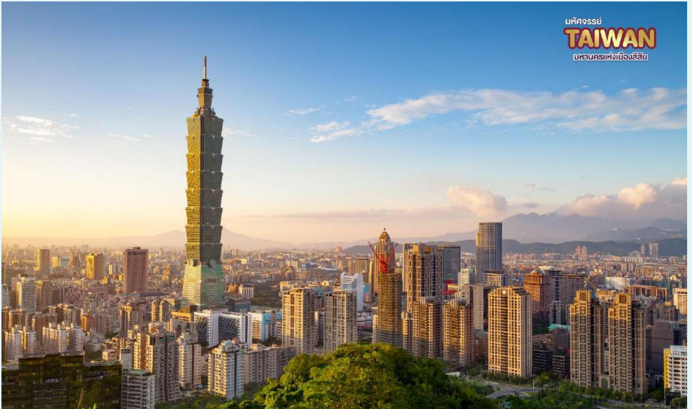
มหัศจรรย์ TAIWAN มหานครแห่งเมืองสี่สี

เที่ยง บริการอาหารกลางวัน ณ ร้านอาหาร พิเศษ!! เมนูเสี่ยวหลงเปา นำท่าน แวะชมของที่ระลึก ผลิตภัณฑ์สร้อย Germanium (GE) ซึ่งทำเป็นเครื่องประดับทั้งสร้อยคอและสร้อยข้อมือซึ่งมีการฝังแร่ Germanium ลงไปมีคุณสมบัติ ลดผลกระทบจากรังสีจากอุปกรณ์อิเล็กทรอนิกส์ปรับความสมดุลในระบบต่างๆของร่างกาย